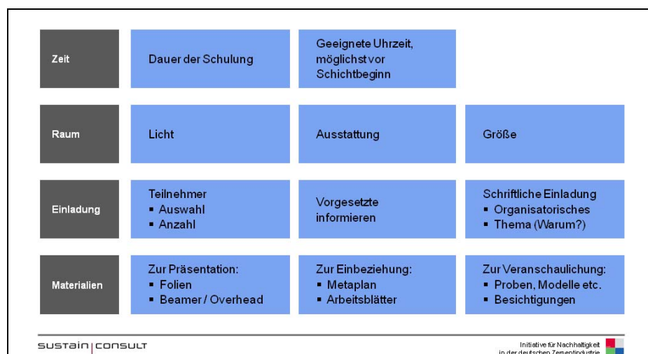
Abb. 1: Aspekte zur Organisation von Schulungen

Ferner ist darauf zu achten, dass die Führungskräfte der eingeladenen Beschäftigten Kopien der Einladungsschreiben erhalten, damit diese sich in keiner Weise übergangen fühlen und Gelegenheit haben, rechtzeitig die Veranstaltung in ihrer Arbeitsplanung zu berücksichtigen.